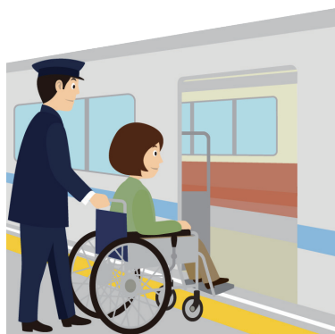
車椅子(車いす)ご利用の方の介助