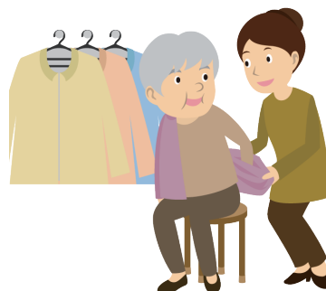
お身体を動かしにくい方のお手伝い